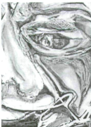
Detalle de Obra «Raíces» Estela Jorge